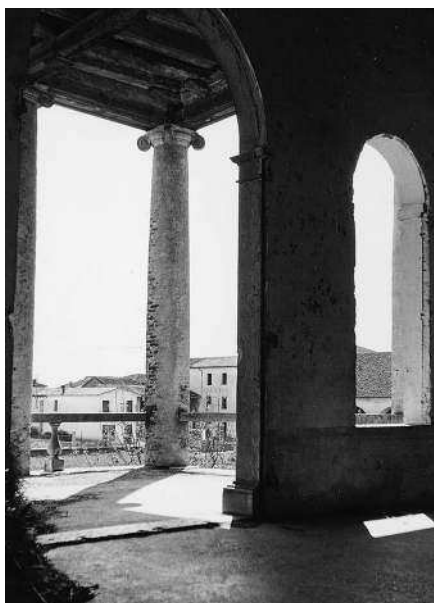
Particolare del fianco