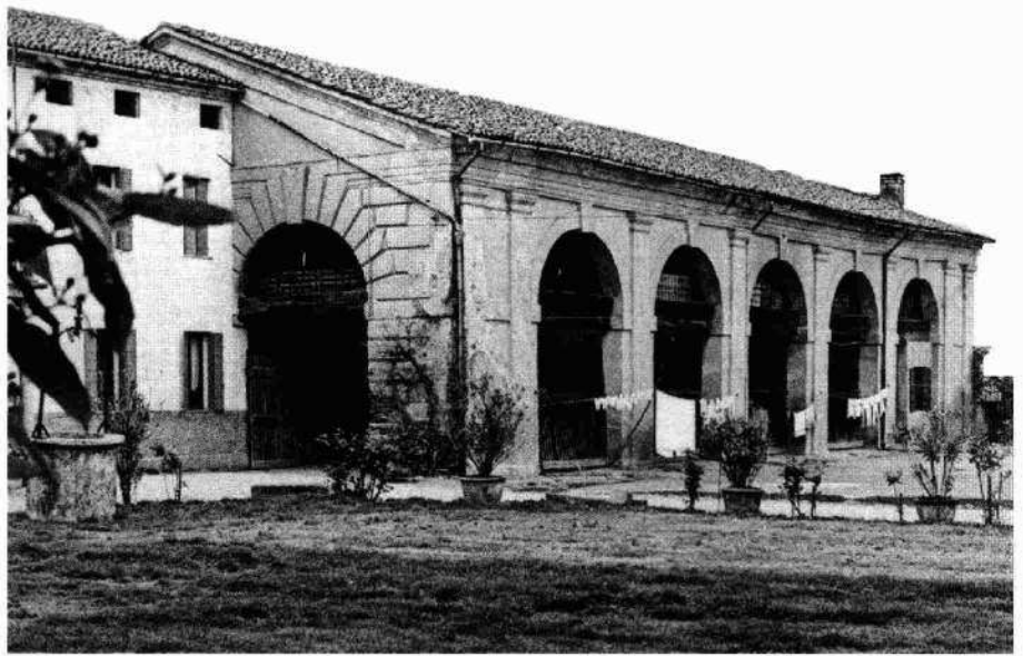
Il progetto del Palladio Vista della barchessa da sud-ovest