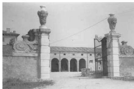
Elegante portale d'ingresso al complesso con pilastri in bugnato e vasi decorativi (Archivio IRVV) Scorcio di una risaia allagata con gli edifici adibiti a deposito (Archivio IRVV)