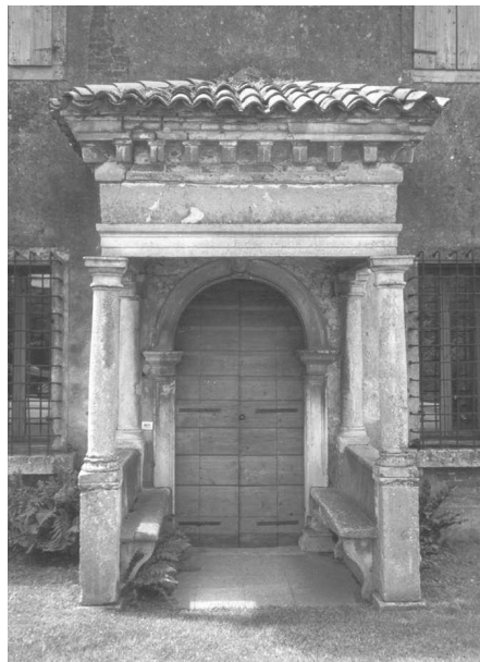
Il protiro del prospetto posteriore (Archivio IRVV) Scorcio sul prospetto posteriore (Archivio IRVV)

Il corpo padronale, orientato nord-sud, è stato ripetutamente sottoposto ad ampliamenti e trasformazioni che hanno modificato l'assetto originario. Particolare interesse riveste la prima parte di questa costruzione, addossata alla torre colombara, che presenta in facciata un elegante portale ad arco a tutto sesto delimitato da elementi in pietra finemente la-