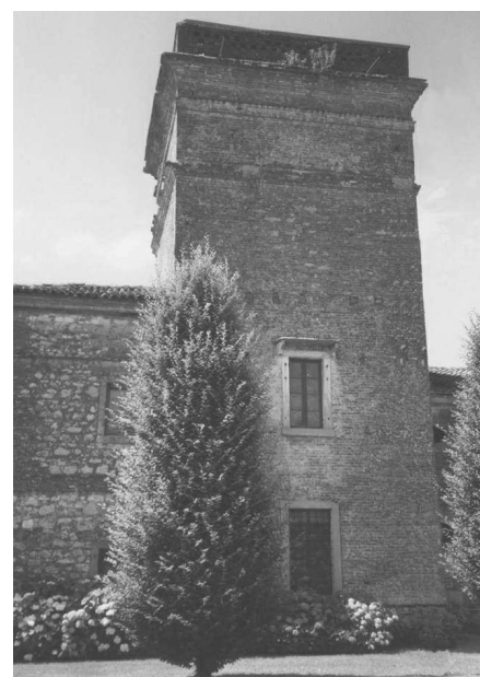
L'ingresso principale alla corte (Archivio IRVV) La torre colombara (Archivio IRVV) L'edificio porticato adiacente al corpo padronale (Archivio IRVV)