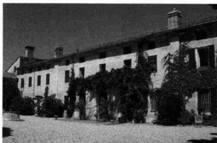
Particolari di un'arcata della barchessa e delle rimesse Il cancello d'ingresso ora inutilizzato L'attuale fronte della villa