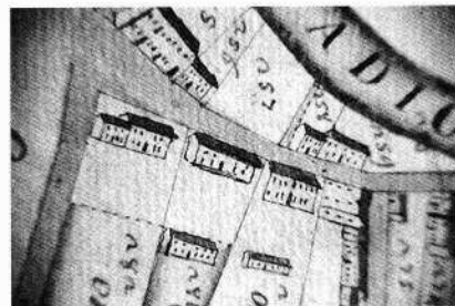
Particolare del fronte occidentale (N.P. 1999)

Particolare della mappa del Catastico veneto del 1775, Ritratto di Campagna Vecchia, Commun della Costa, ACR, m. 35, mp. 283