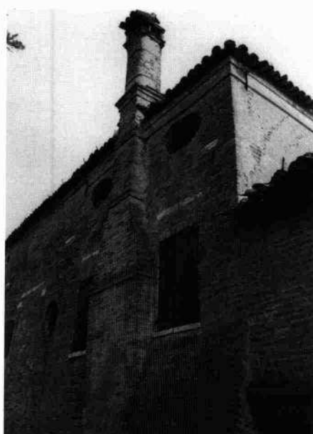
Il fronte stradale visto da sud La facciata meridionale Il camino del fronte settentrionale Particolare delle cantine