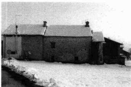
Il retro della casa (L. De Bortoli, 2004)

Veduta di scorcio della casa e degli annessi (L. De Bortoli, 2004)