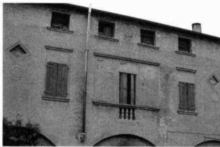
Particolare del fronte principale con la trifora tamponata Decoro lapideo Il retro del complesso