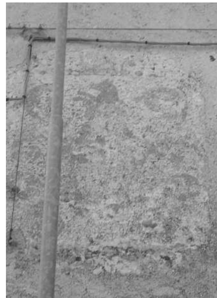
Porta con stemma (F.P.) Resto dell'affresco con lo stemma della famiglia Porcastri (F.P.)