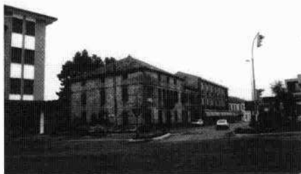
La villa nel contesto urbano Particolare del prospetto Le adiacenze orientali