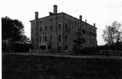
Il fronte rivolto verso la corte della barchessa posta a est (R.M. 1988)