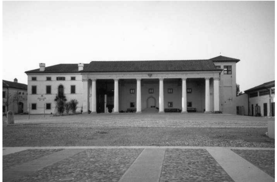
Scorcio della corte con sullo sfondo la villa

È di Gaspare Bighignato, infatti, il disegno del 1711 che in maniera dettagliata descrive il "Feniletto" passato dai Baughi ai Peccana. Il complesso edilizio è riprodotto con corte, torre colombara, palazzo padronale e con la vecchia barchessa che verrà ristrutturata.