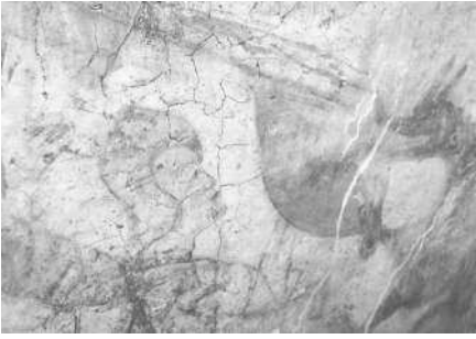
Particolare di pittura murale rappresentante San Giorgio e il drago e collocata sulla torre colombara (Archivio IRVV)

Vista parziale di un affresco rappresentante un tritico con al centro una Madonna con Bambino in trono, localizzato nel corpo posto a nord (Archivio IRVV)