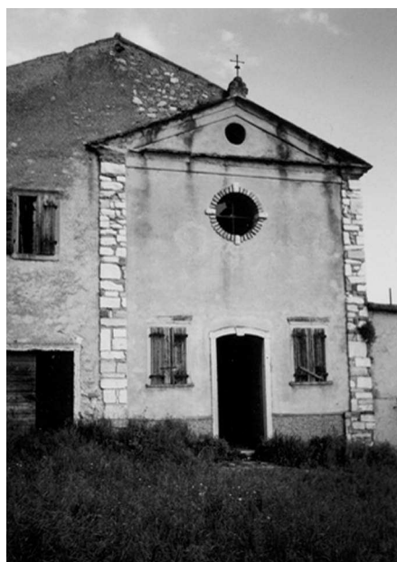
La cappella inglobata nella struttura del complesso