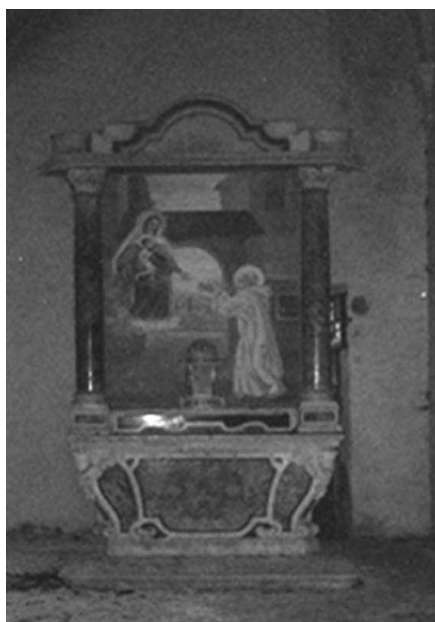
L'interno della chiesa con l'altare in marmo giallo di Torri

corpo di settentrione s'allungò ulteriormente fino ad addossarsi all'edificio chiesastico, coprendolo parzialmente, sul lato orientale e sul settentrionale a parreggiarsi in linea con la facciata della chiesa; i due corpi di meridione, quello contiguo e quello isolato, furono invece abbattuti.