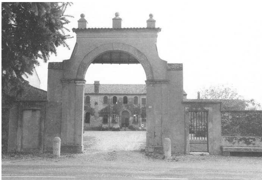
Il monumentale ingresso alla corte

All'interno della proprietà è pure visibile, tra gli alberi del brolo, l'antica "giazara" con la volta d'accesso in cotto.