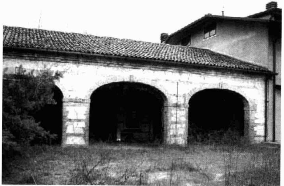
Il corpo ottocentesco La barchessa