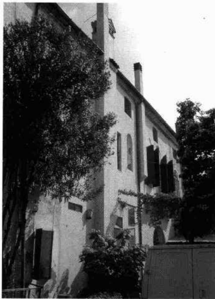
Veduta del cortile e della barchessa occidentale Scorcio della facciata meridionale La villa vista dal cortile