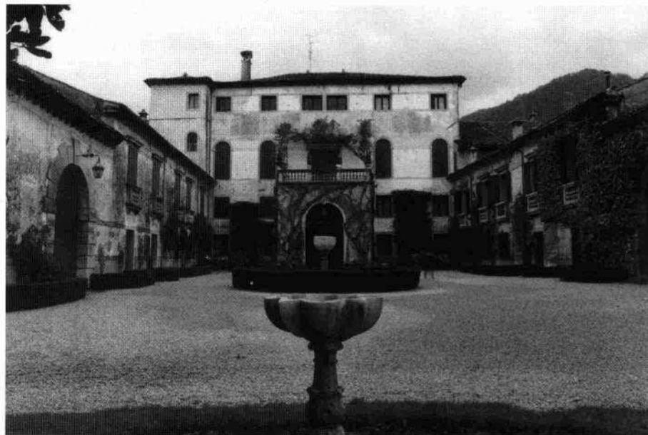
Vista della facciata interna e della corte

Le parti seicentesche, con copertura a capanna, si sviluppano su due piani ed hanno il fronte che prospetta sul giardino, caratterizzato da una sequenza di cinque monofore rettangolari con cornice in pietra liscia al piano terra; quelle al primo piano sono arricchite da una cimasa sporgente in pietra e sono tutte chiuse da un poggolo a sbalzo, con la balaustra ad elementi a doppia anfora. Le parti terminali costruite nel 1714 hanno un ampio portale a tutto sesto con cornice a concì di pietra dalle dimensioni alterne.