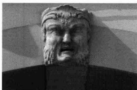
La facciata orientale Particolare delle arcate del piano terra I mascheroni in chiave dell'arco settentrionale e dell'arco meridionale