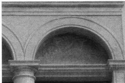
La vera da pozzo nel cortile La facciata interna orientale La trifora del fronte principale Particolare della decorazione di una lunetta di facciata