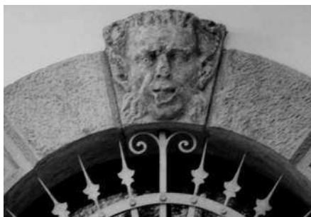
Particolare del mascherone del portale d'ingresso