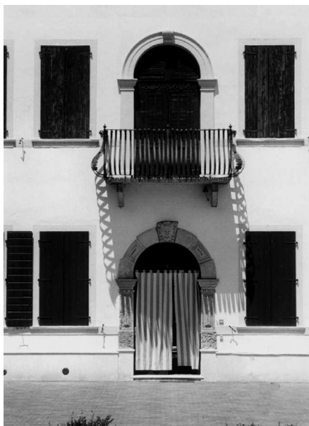
Scorcio del prospetto posteriore della villa