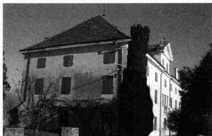
Veduta laterale (C. Benvegnù, 2003) Particolare del frontone (C. Benvegnù, 2003)