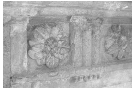
Particolare del fregio (Archivio IRVV) Il settecentesco portale d'ingresso (Archivio IRVV)

tro vertici dell'edificio. L'effetto creato è molto decorativo perché gli aggetti, seppur minimi, sono sufficienti a creare un efficace gioco di chiaroscuri. Le aperture, a profilo architravato al pianterreno e centinate al piano nobile, trovano esatta collocazione all'interno della maglia definita dall'ordine: sull'asse centrale di simmetria, al piano terra, è collocato il portale d'ingresso al corpo padronale dal profilo ad arco a tutto sesto. Il fronte nord della villa, identico nell'impaginato e nelle proporzioni a quello principale, è tuttavia privo del piatto ordine architettonico che connota il fronte maggiormente significativo.