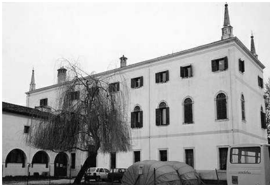
Il fronte posteriore

baron". È assai probabile, come confermano fonti storiche locali, che l'intero complesso appartenesse al vescovato già nel 1460 quando il vescovo Ermolao Barbaro procedette al restauro e alla ristrutturazione di gran parte degli edifici di proprietà vescovile perché, scrive Scola Gagliardi, «un portale in marmo di Verona di forme gotiche, tuttora conservato all'interno dell'edificio, è simile ad altri che si trovano nel palazzo vescovile di Monteforte, ristrutturato dal Barbaro appunto in quell'anno». Sebbene il vescovo di Verona avesse diritto di feudo nei territori di Bovolone ancora nel IX secolo, come attesta