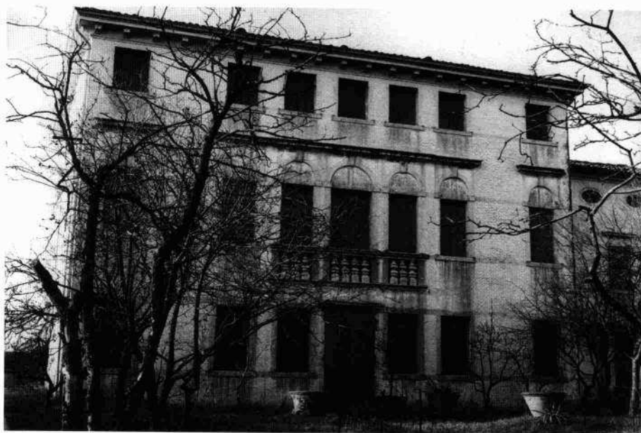
Il fronte sud della villa

Gli ambienti conservano le travature alla sansovina, pavimentazione in terrazzo alla veneziana ed alcuni caminetti di elegante fattura ("Ville venete", 1999).