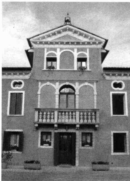
Particolare del settore centrale della facciata

Sul lato occidentale del complesso si sviluppa in addossamento un'adiacenza rustica, ristrutturata con materiali e forme moderne, che altera non poco l'immagine dell'insieme.