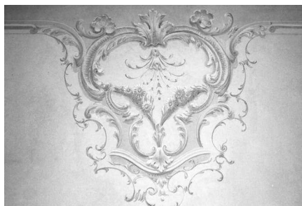
Particolare della decorazione ad angolo del soffitto della sala centrale al piano terra