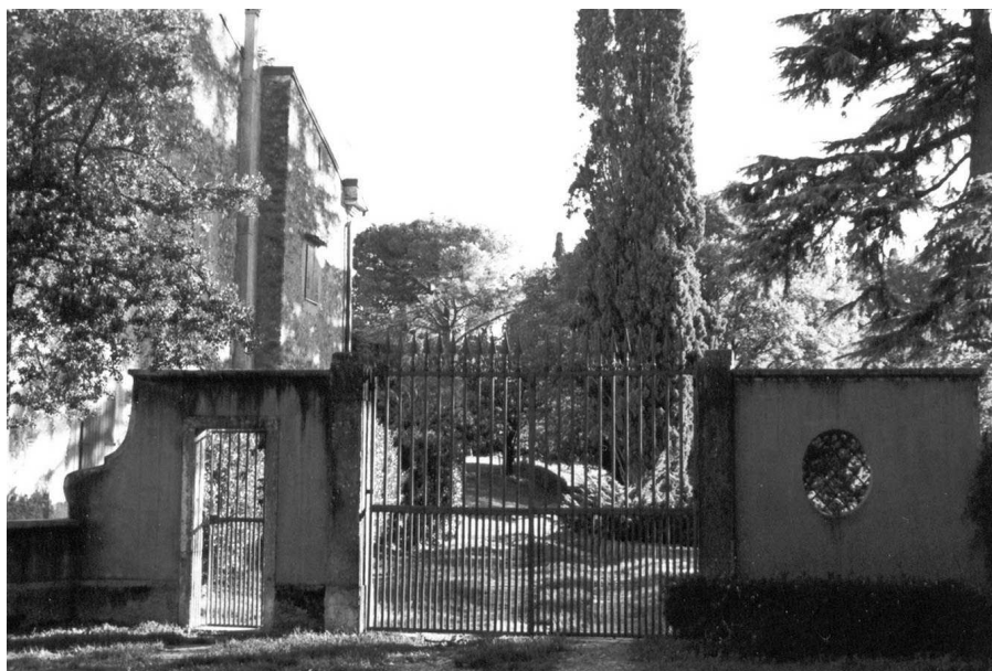
Scorcio dello splendido viale detto "dei pigni" costeggiato da ambo i lati da secolari cipressi