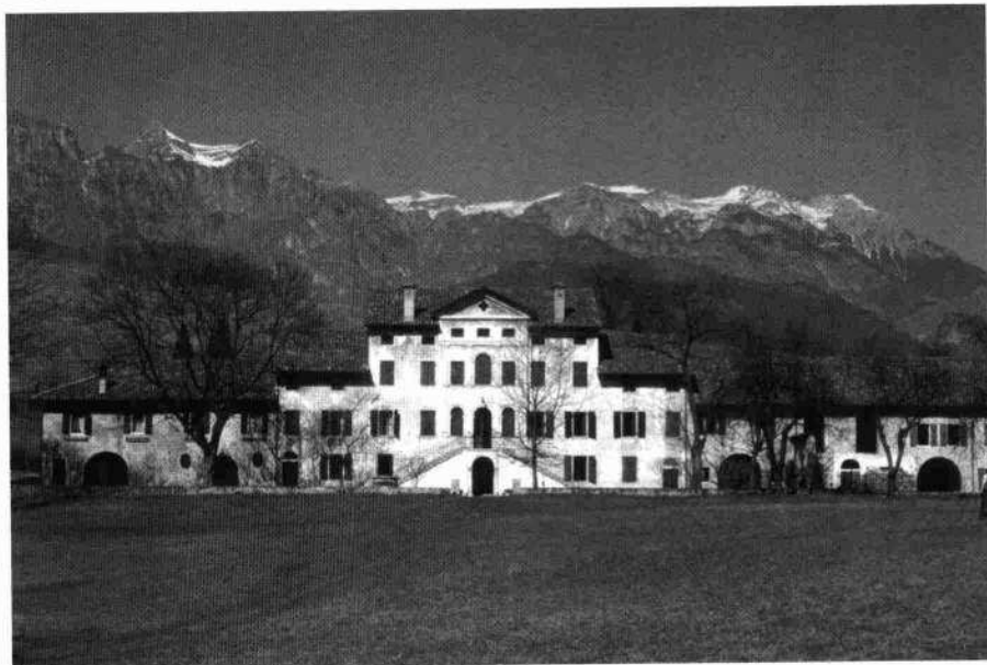
Veduta del complesso da sud Particolare della facciata principale

L'oratorio è dedicato a San Bovo ed è stato ritinteggiato negli ultimi decenni. Il motivo di facciata è quello tetrastilo semplificato in quattro esili lesene sostenenti un semplice timpano. L'interno, ad aula unica, termina nella piccola abside voltata a vela contenente un altare in muratura e stucchi che inquadra una pala raffigurante la Vergine tra i santi Bo-