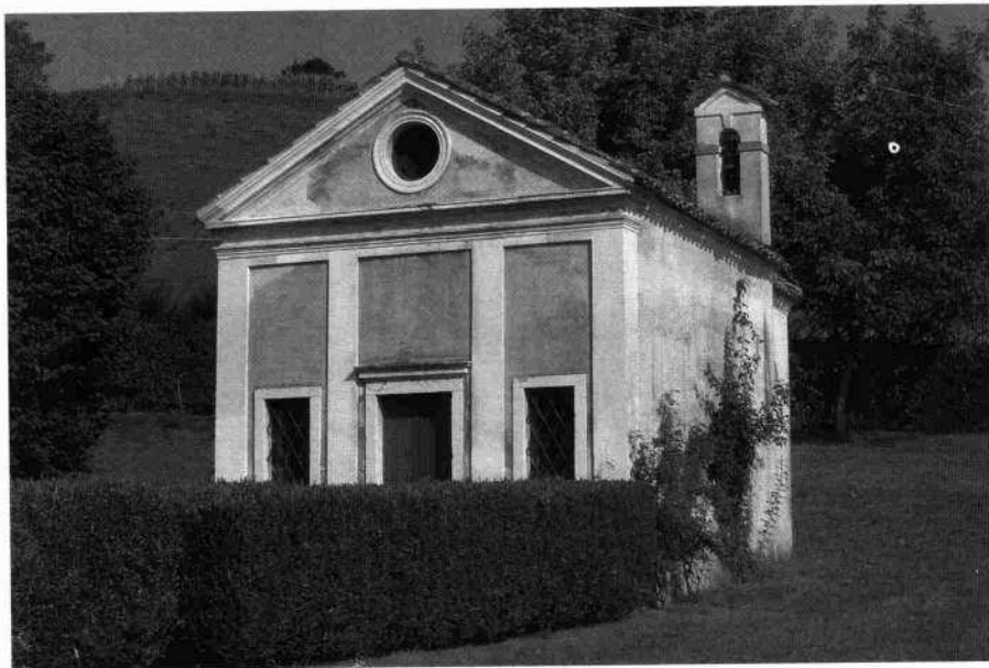
L'oratorio (L. De Bortoli, 2003) Il corpo rustico (Archivio IRVV, 1989) Veduta del fronte nord del complesso (C. De Bortoli, 2003)

La villa, utilizzata come residenza di campagna dagli attuali proprietari, con una parte dei rustici trasformata in abitazione del custode, si trova in un ottimo stato di conservazione, raggiunto attraverso i periodici interventi di manutenzione, gli ultimi dei quali hanno interessato le coperture.