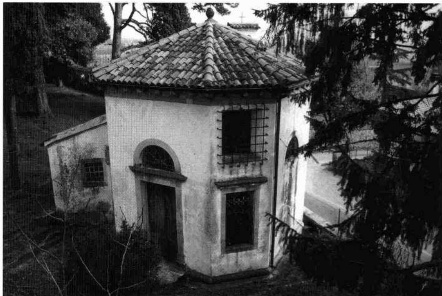
Veduta del giardino davanti alla villa (Archivio IRVV) L'oratorio (Archivio IRVV)

Il restauro decorativo fu operato nel primo dopoguerra dall'artista locale Emilio Fontana (Dall'Anese-Martorel, 1991)