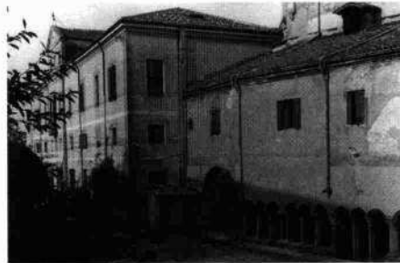
Lo stemma araldico dei Carminati in chiave di volta Veduta esterna con la chiesa Il fronte interno del complesso Scorcio del chiostro sul fronte interno