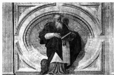
G. Porta (attr.), Annunciazione, San Girolamo, San Pier Damiani L'interno del chiostro