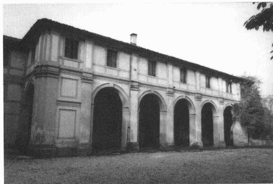
Veduta laterale della barchessa e della villa (S.C. 1998)

La significativa profondità del corpo di fabbrica della barchessa fa sì che i fronti laterali siano definiti da una campata aperta ad arco, nella prima parte in corrispondenza del portico, a cui segue un tratto di parete con due assi di finestre scandite dallo stesso ordine di lesene della facciata principale. Un semplice cornicione modanato, girando su tutti i lati, conclude l'edificio. Sotto al portico si apre un portale in corrispondenza della campata centrale ed altre porte a profilo architravato, con cornici in pietra.