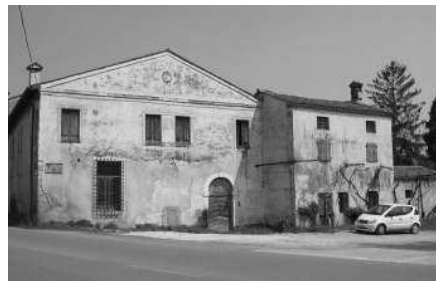
Fronte su strada della barchessa occidentale (F.P.) Barchessa occidentale (F.P.)

Nel catasto austriaco del 1843 (Leonardi, Thiella 1984) compaiono due edifici ai lati delle due barchesse: quello a est è stato evidentemente distrutto. Dopo le famiglie Cavajon o Cavaggioni, Vecchia e Maddalena, la villa è ora proprietà dei Dal Ferro di Thiene (Saterini 1990).