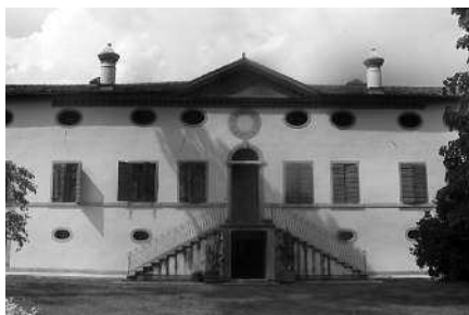
Settore centrale della facciata (S.V.) Prospetto dell'oratorio di Santa Giustina (S.V.)

L'oratorio, dedicato a Santa Giustina, ha una facciata a capanna con porta architravata, sormontata da una lapide e da una lunetta, e due finestre laterali sovrastate da incassi che ospitano raffigurazioni sacre dipinte. La villa, raffigurata in una mappa del 1609 (Celotto 1982), fu eretta dai nobili Cesana presumibilmente a ridosso di questa data o nella seconda metà del Cinquecento. All'epoca risultava in sito un corpo di fabbrica più ristretto, corrispondente agli attuali sei assi centrali, affiancato da due torri più alte, in seguito mozzate e inglobate nella costruzione, dove sono identificate dai due settori privi della cornice di coronamento. L'ultima fase costruttiva risale al Settecento, ad opera della famiglia Bellavitis, originaria di Bassano, che nel 1709 ricostruì anche l'oratorio, già presente un secolo prima.