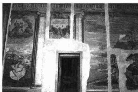
Particolari degli affreschi del secolo XVI nel piano nobile e del secolo XVII nel secondo piano.