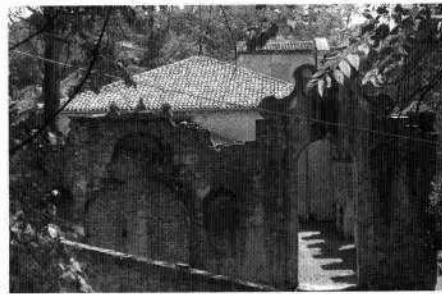
Particolare della loggia del fronte meridionale Il giardino segreto in un'immagine d'epoca Il complesso visto dalla mura di cinta Il giardino segreto attualmente