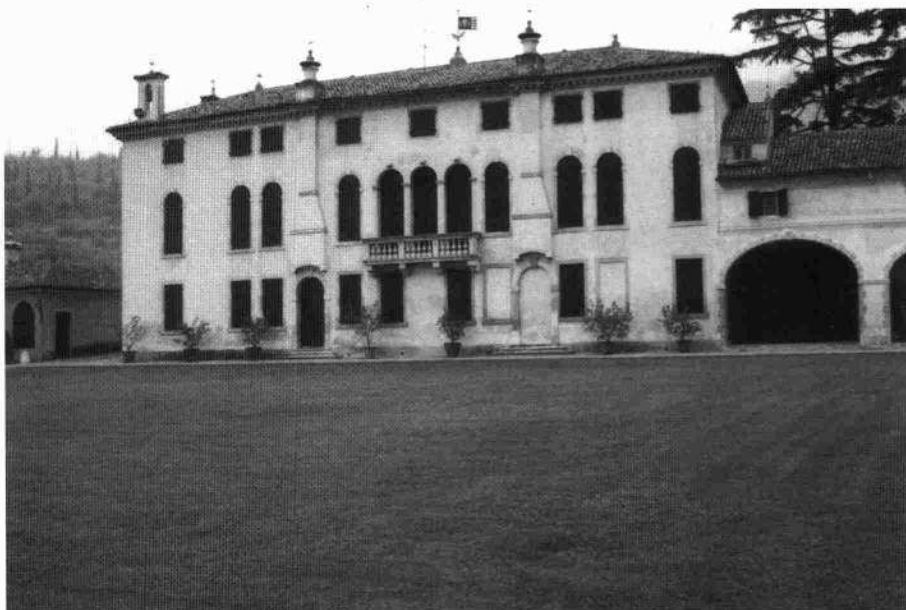
La villa vista dal giardino antistante

La decorazione degli interni del piano nobile del palazzo, stucchi ed affreschi unitariamente impostati secondo la cosiddetta tecnica "rocaille", viene variamente attribuita: predomina tra tutti il nome di Andrea Urbani per i primi e di Jacopo Guarana per i secondi. Le scene principali illustrano il "Pastor Fido" del Guarini, con figure di giovani che giocano a mosca cieca, il matrimonio degli innamorati, la festa campestre, alle quali si accompagnano figure allegoriche e decorazioni a finto stucco.