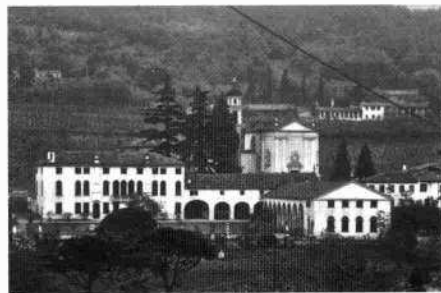
Un particolare degli affreschi e una scena del "Pastor Fido" di J. Guarana La villa nel contesto ambientale Un'altra veduta generale del complesso