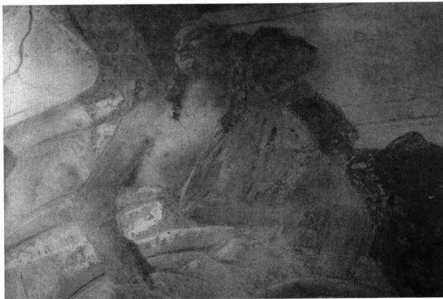
Particolare della villa della «N.D. Corner» a «Merlengo Capo d'Aqua» nella mappa di Angelo Prati del 1763 (ACBM, Prati A. «Dissegno generale di tutta la Brentella», ms., tavola 34, 1763) Particolare di un affresco (Archivio IRVV)

Al termine di un vivace scambio di opinioni sulla metodologia di restauro scientificamente più corretta, l'intervento è stato portato a termine seguendo le prescrizioni fornite dagli organi competenti, ovvero operando solamente una «pulitura» ed una «reintegrazione pittorica a velature di acquerello», limitata, quest'ultima, al minimo indispensabile, «in relazione alle necessità di evidenziare le parti meno leggibili della figurazione, nell'assoluto rispetto del testo pittorico originale».