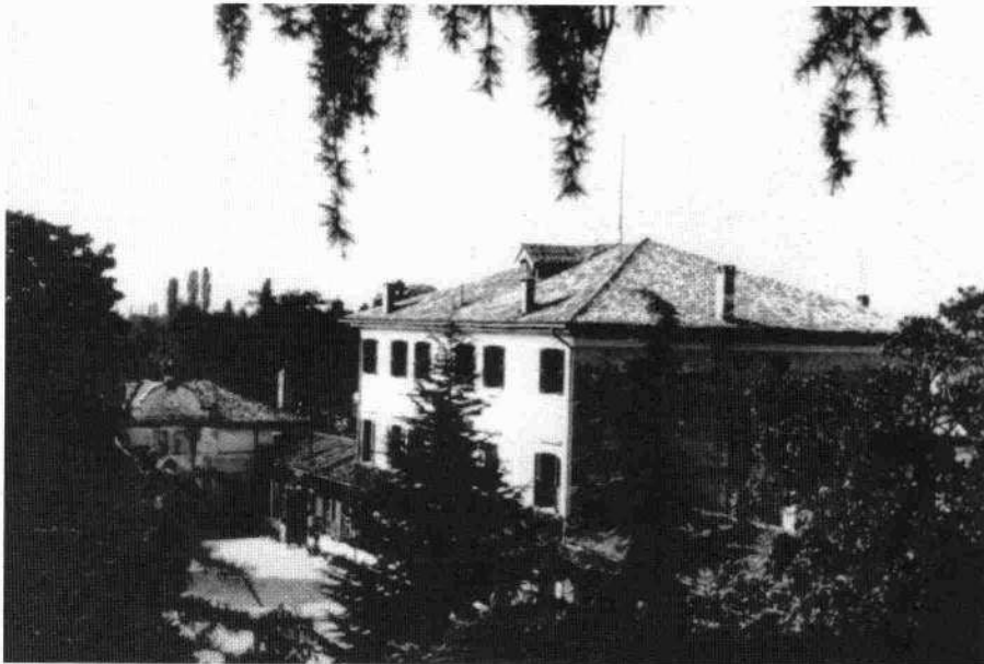
Veduta del fronte interno del complesso; sullo sfondo l'adiacenza porticata con frontone mistilineo