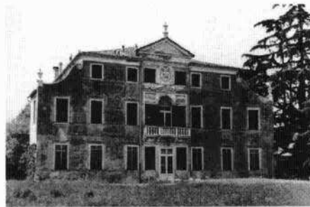
La villa in una fotografia d'archivio Particolari degli affreschi di A. Urbani