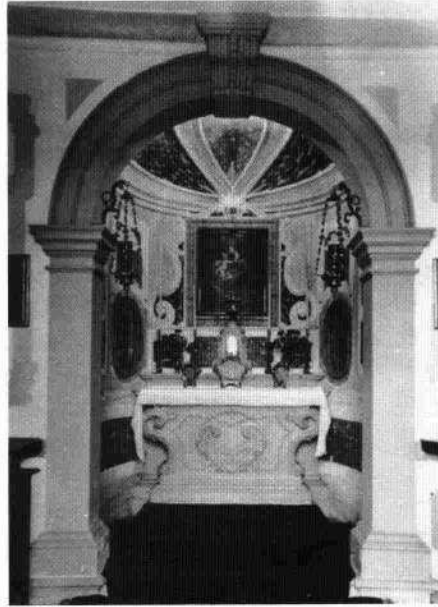
Particolare degli affreschi di A. Urbani Il salone interno L'interno della cappellina

Negli interni si mantengono le strutture lignee dei solai alla sansovina. L'apparato decorativo delle stanze è di mano di Andrea Urbani; ricordiamo a pian terreno il salottino decorato con prospettive entro un finto loggiato a colonne di ordine ionico su basamento con vedute di giardini, uno con esedra fontana e pappagallo blu poggiato sulla balaustra e l'altro con una coppia: dama e cavaliere. Al primo piano una stanza mostra le pareti a monocromo con medaglioni e divinità al soffitto, un'altra presenta un fregio ad uccellini sempre a soffitto; al secondo piano incontriamo un fregio a greca con figure mitologiche in una camera, paesaggi con rovine alle pareti e simboli delle arti e della caccia entro motivi vegetali a soffitto.