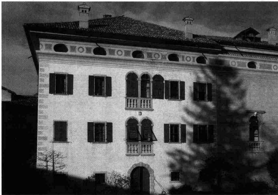
Prospetto sud dell'ala di rappresentanza (L. De Bortoli, 2003)

terrazzini in pietra sostenuti dalle caratteristiche mensoline a volute piatte. Ai lati le aperture, disposte regolarmente a coppie, sono sormontate da semplici timpani, triangolari al primo piano e curvilinei al secondo. Il fronte nord verso il broi è d'impostazione simile, ma presenta centralmente delle bifore. Il portale è invece molto più ricco, racchiuso tra due semicolonne ioniche a bugne. Un largo cornicione chiude in alto le murature sotto il notevole oggetto delle coperture: semplici motivi geometrici si alternano alle grandi aperture ovali del sottotetto. Le angolate sono infine trattate a finta bugnatura, mentre