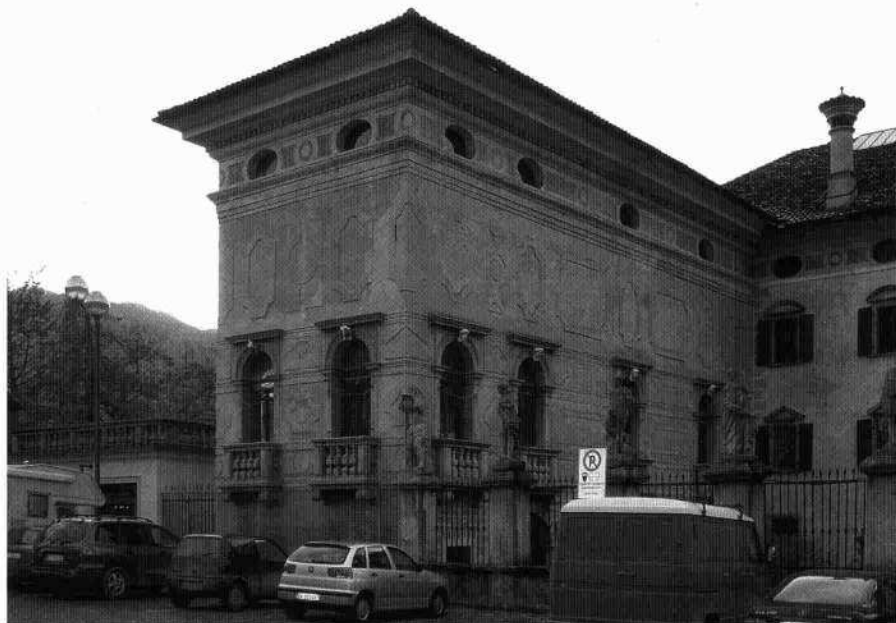
Veduta della Torresella da sud-est (L. De Bortoli, 2003)

è risolto con una partitura geometrica ad intonaco. Questo motivo è ripreso anche al livello inferiore dove è alternato alle grandi finestre ad arco, aperte su poggiali in pietra e sovrastate da un architrave che si innesta sulle fasce marcapiano. Le grandi volte a padiglione interne sono riccamente decorate a stucchi. Una scala di collegamento dai saloni del primo piano con il sottostante portico non fu mai terminata. Il corpo addossato a sud dell'edificio occidentale, i cui altri fronti sono semplicemente trattati a fasce marcapiano e partiture geometriche sotto alle aperture, è risolto con un portico e sovrastante