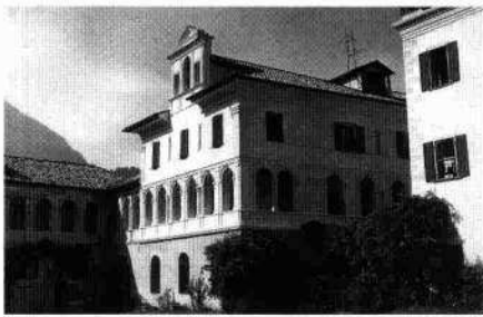
Veduta di scorcio dell'ampliamento settecentesco (Archivio IRVV, 1972) Il prospetto meridionale del corpo principale (L. De Bortoli, 2003)