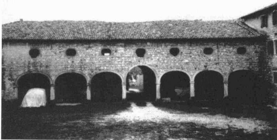
Il lungo fronte sulla strada (L.S. 1998) L'adiacenza rustica (Archivio IRVV)

Il fronte est presenta, al piano terra, un portico rettilineo composto da una sequenza di archi a sesto ribassato con il profilo e i pilastri d'appoggio in pietra. L'arco centrale è a tutto sesto e segna un passaggio che attraversa l'edificio fino al fronte opposto. Al piano sottotetto si aprono finestrelle ovali dal profilo in laterizio.