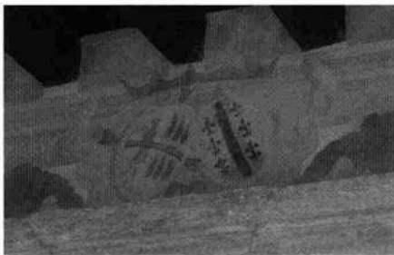
Il portico (L. De Bortoli, 2003) Particolare dello stemma Facen-Orum (L. De Bortoli, 2003) Particolare del portale d'ingresso (L. De Bortoli, 2003) Particolare della decorazione interna del portico (L. De Bortoli, 2003)