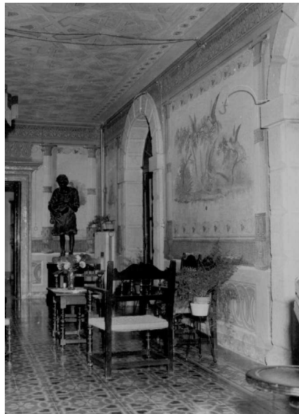
Particolare delle decorazioni interne