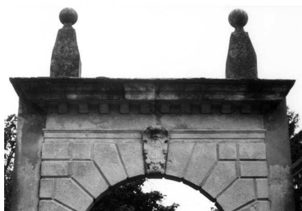
Il fronte dell'oratorio