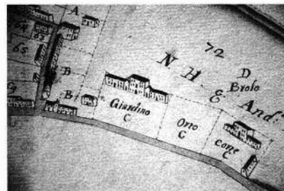
Il fronte settentrionale della casa padronale (M.B. 1999)

Due piccoli corpi di fabbrica, che ospitano le cappelle, sono posti tra la casa e le ali. La facciata è limitata da un portale a bugnato sormontato da un timpano modanato.