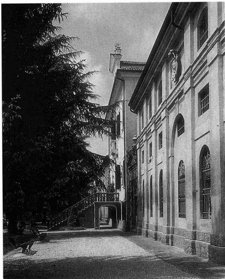
Particolare del fronte meridionale della casa padronale (G.D.S. 1989) Scorcio dell'ala orientale (M.B. 1999)