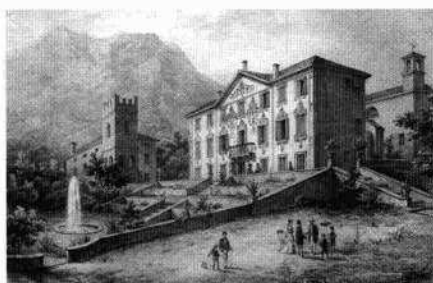
La litografia di Marco Moro (da: Vecellio, 1876) Veduta del complesso e del parco-giardino (L. De Bortoli, 2003)