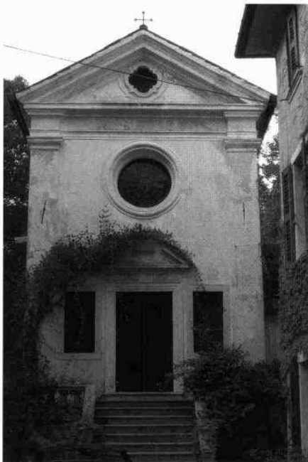
L'oratorio (L. De Bortoli, 2003)

Nonostante da qualche tempo non si odano più i nitriti dei cavalli, le particolari cure dei proprietari e le estensioni, ben tenute, di piante rampicanti danno ancora oggi al complesso un'aria romantica tipicamente ottocentesca.