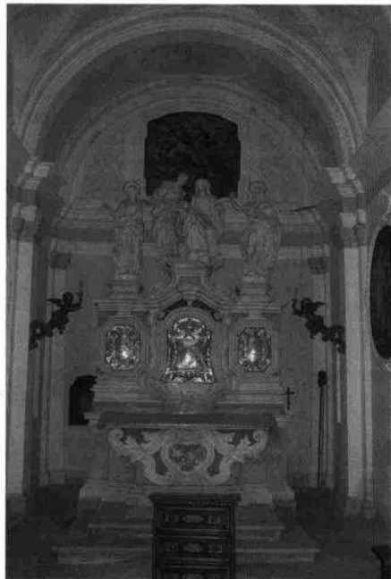
Interno dell'oratorio: l'altare (L. De Bortoli, 2003)