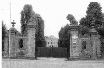
L'ingresso all'oratorio inglobato nel corpo della barchessa