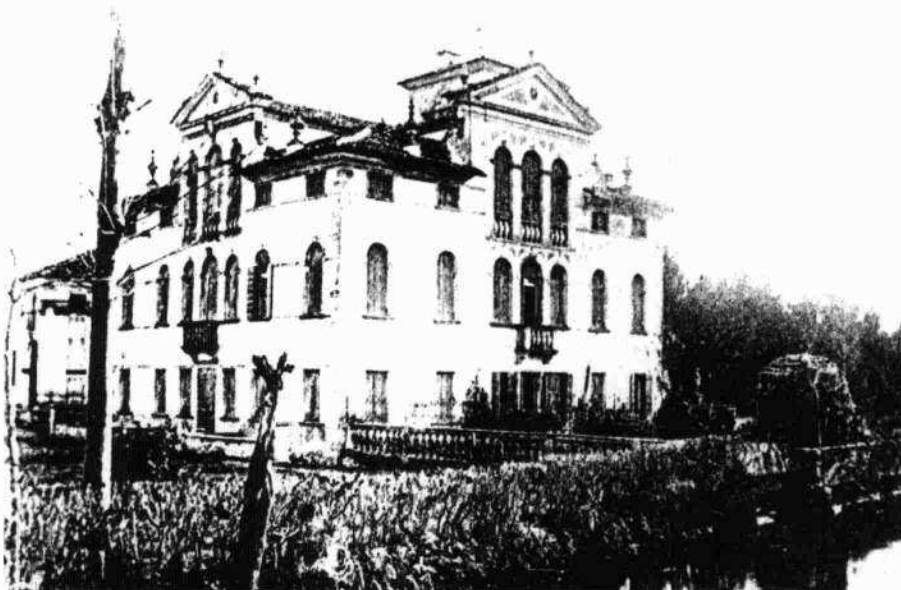
La villa, non più esistente, in una vecchia foto del 1888

Le facciate trovano conclusione in un cornicione formato da mensoline su cui poggia la copertura a piramide.