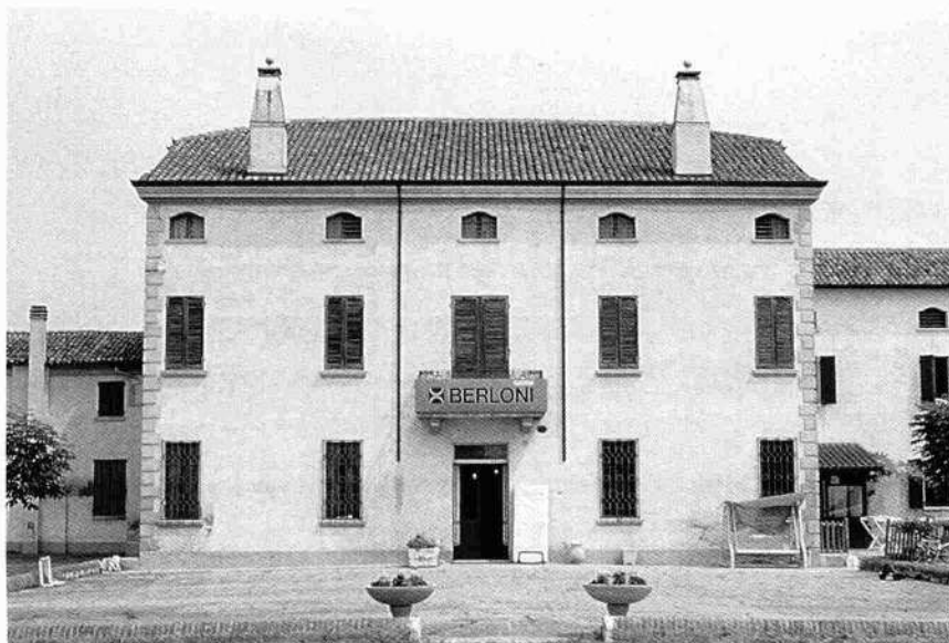
Il fronte principale della casa padronale (N.P. 1999)

Il corpo principale presenta ai lati due costruzioni di altezza minore: l'ala est riprende i caratteri della casa, ma con tetto a capanna; l'ala ovest, più bassa, presenta un camino aggettante a sud. Quest'ultimo, tuttavia, è stato troncato, probabilmente per permettere l'apertura di un portone d'ingresso all'autorimessa.