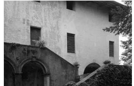
Scalinata nel prospetto meridionale (E.U.) Particolare della loggia del prospetto meridionale (E.U.)

Situato al di sopra di essa, e appartenente alla medesima proprietà, è un tozzo edificio quadrangolare la cui origine sembrerebbe molto antica. La sua mole robusta e la posizione strategica, hanno fatto pensare ai resti di una fortificazione più che a una colombara. Ripreso in varie epoche, venne completato, forse nel Cinquecento, da una struttura cilindrica con scala a chiocciola (Rigon 1982).