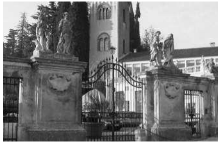
Prospetto principale (C.B.) Cancellata di ingresso alla proprietà (C.B.) Prospetto posteriore; a sinistra si sviluppa il portico che chiude a est il giardino sul retro della villa (C.B.) Cappella sul retro della villa con fronte sulla strada (C.B.)