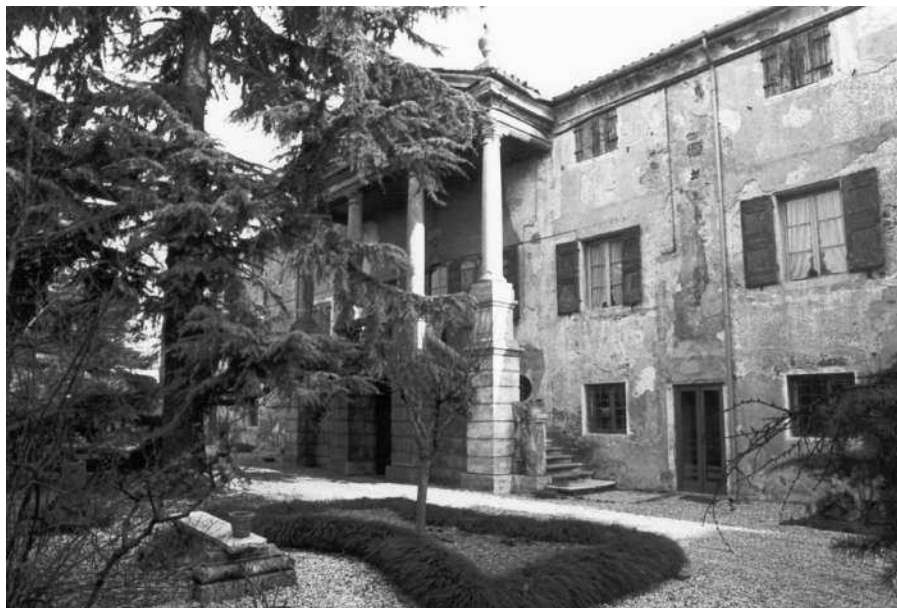
La villa in una vecchia foto, prima del restauro