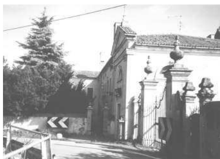
Scorcio dell'oratorio dalla strada (Archivio IRVV) La barchessa (Archivio IRVV)